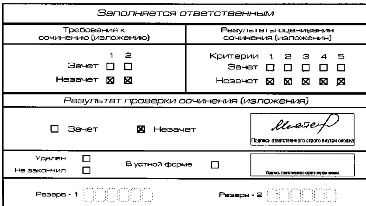
Рис. 11. Область для оценки работы

Выставляется «незачет» за невыполнение требования № 2. В клетки по всем критериям оценивания выставляется «незачет». В поле «Результат проверки сочинения (изложения)» ставится «незачет» (см. рис. 12).